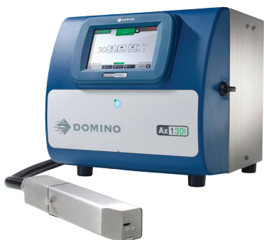
Ax130i – une solution idéale pour tous vos besoins de codage de base