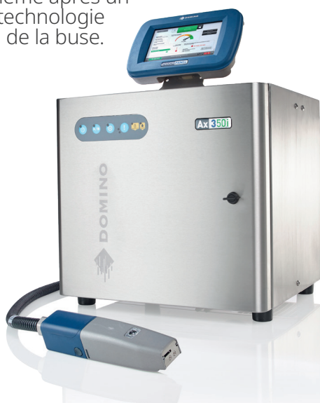
Ax350i – toute la flexibilité de la technologie jet d'encre continu