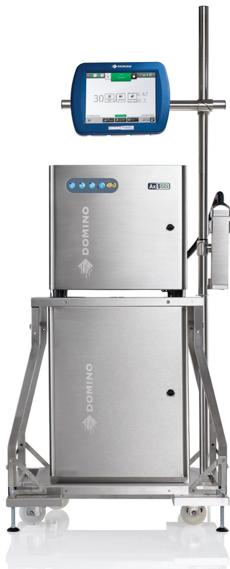
Ax550i – dans les environnements difficiles, le modèle Ax550i est imbattable