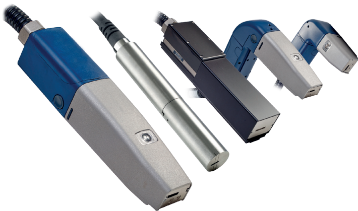
Logos et codes 2D