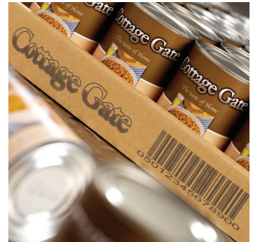
낮은 박스트레이 코딩 예