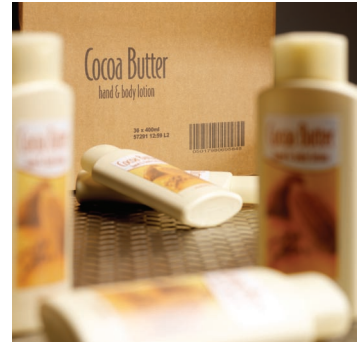
멀티헤드를 이용한 박스 코딩 예